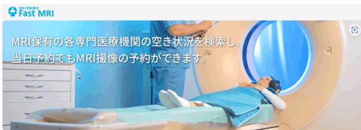
はまと脳神経クリニックからの お知らせ